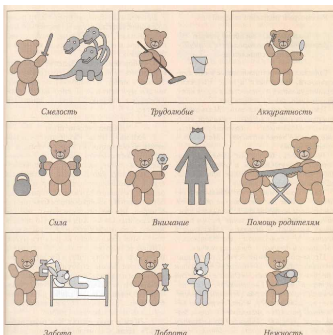
Рис. 3. Карточки-символы к игре «Кто живет в твоём сердце?»

Задание. Получив карточки-символы, схематически изображающие понятия «доброта», «красота», «честность», «смелость», «сила» и т.д. (см. рис. 3), отобрать те, которые обозначают ценности, определяющие и направляющие поведение мальчика и девочки. В качестве символа можно воспользоваться изображением мишки, выполняющего различные действия.